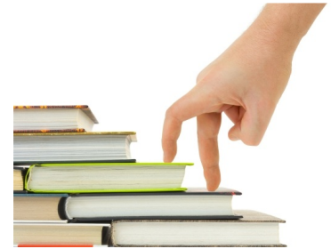
CUERPO DE PROFESORES DE ENSEÑANZA SECUNDARIA